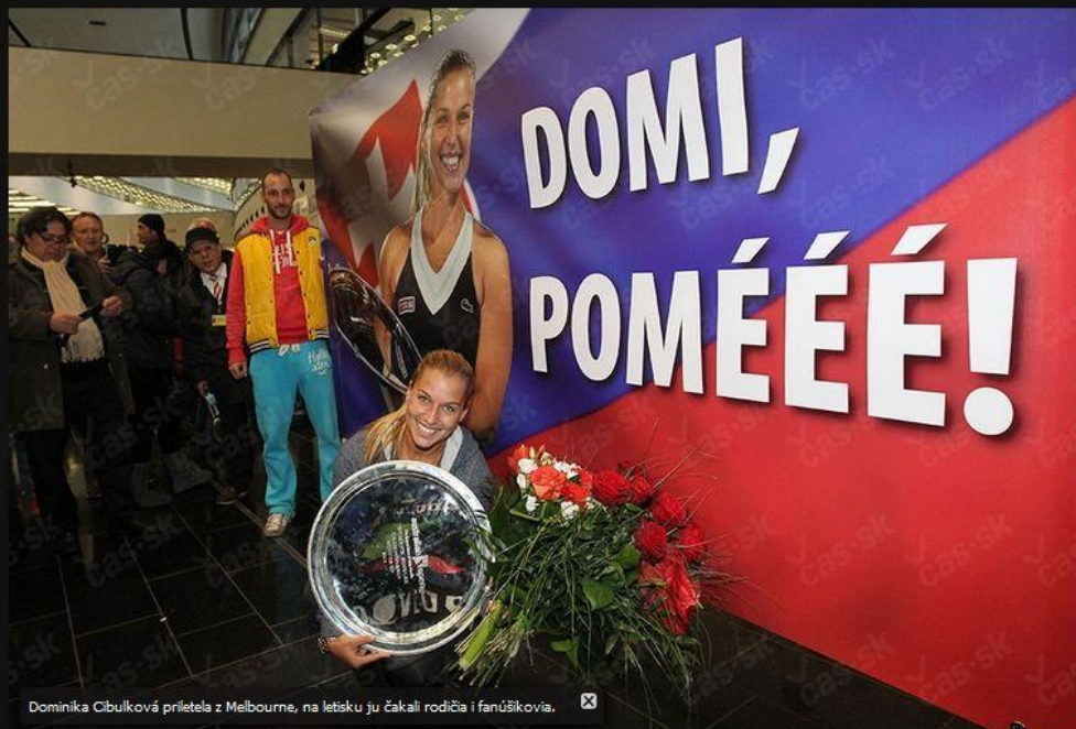
Dominika Cibulková prietela z Melbourne, na letisku ju čakali rodičia i fanúšikovia.

Fotogaléria: Prvé foto Cibulkovej po návrate z Melbourne: Na letisku ju vítali aj dvaja chlupáči a limuzína